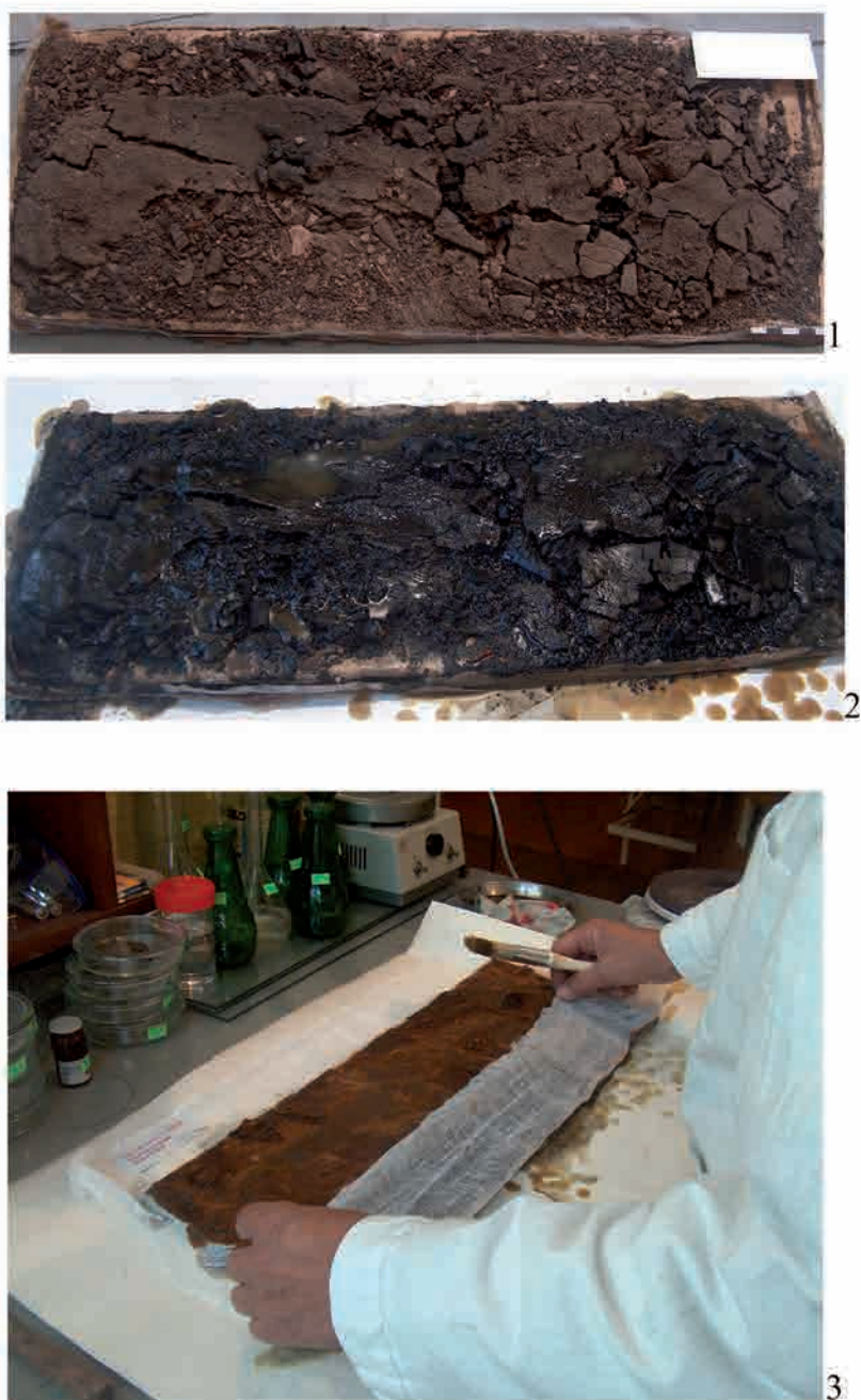
Рис. 2. Первый этап работы с объектом: 1 – внешний вид предмета после распаковки; 2 – закрепление лицевой поверхности объекта воско-канифольной смесью; 3 – укрепление лицевой поверхности двумя слоями марли и воско-канифольной смесью.