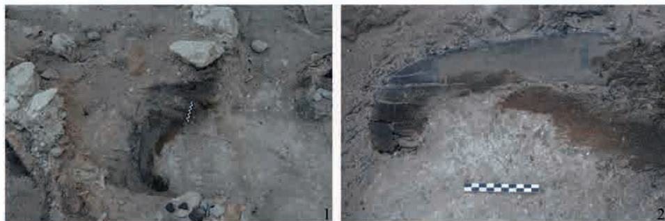
Рис. 1. Местонахождение деревянного блюда в раскопе: 1 – в процессе расчистки; 2 – после расчистки.

Присутствие специалиста-реставратора во время исследования археологического объекта было бы идеальным решением. Однако зачастую возможности пригласить профессионального реставратора отсутствуют: здесь и фактор времени, если раскопки уже ведутся, и удаленность объекта, и финансовая составляющая, а самое главное – это малочисленность специалистов-реставраторов. В результате археологи продолжают самостоятельно извлекать из грунта предметы из деградирующих материалов, предпринимая попытки провести полевую консервацию предметов собственными силами, используя подручные материалы (чаще химические составы). Но не всегда в полевых условиях имеются именно те химические составы, применение которых целесообразно в конкретном случае [Алтынбеков, 2010; 2014].