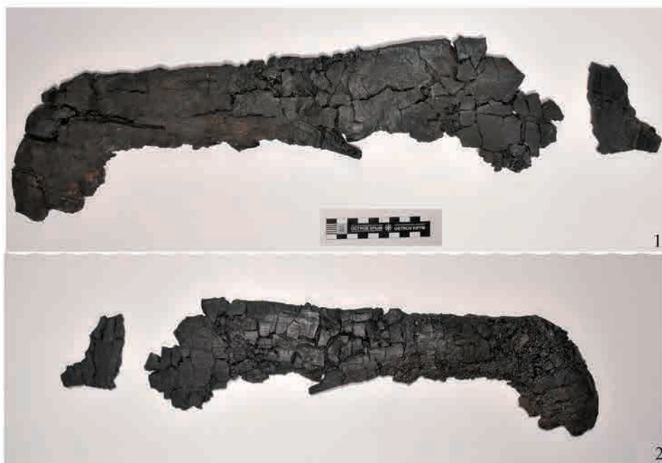
Рис. 4. Предмет после реставрации: 1 – лицевая сторона блюда; 2 – оборотная сторона блюда.

В результате анализа обстоятельств проведения консервационно-реставрационных работ блюда из обугленной древесины с поселения Токсанбай, сложностей, возникших во время проведения отдельных этапов, и появилась идея написания этой статьи. К сожалению, не все археологи владеют знаниями и умениями консервации предметов в полевых усло-